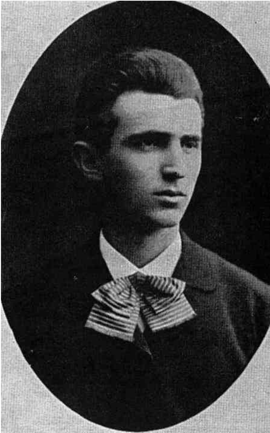
A estranha vida de Nikola Tesla