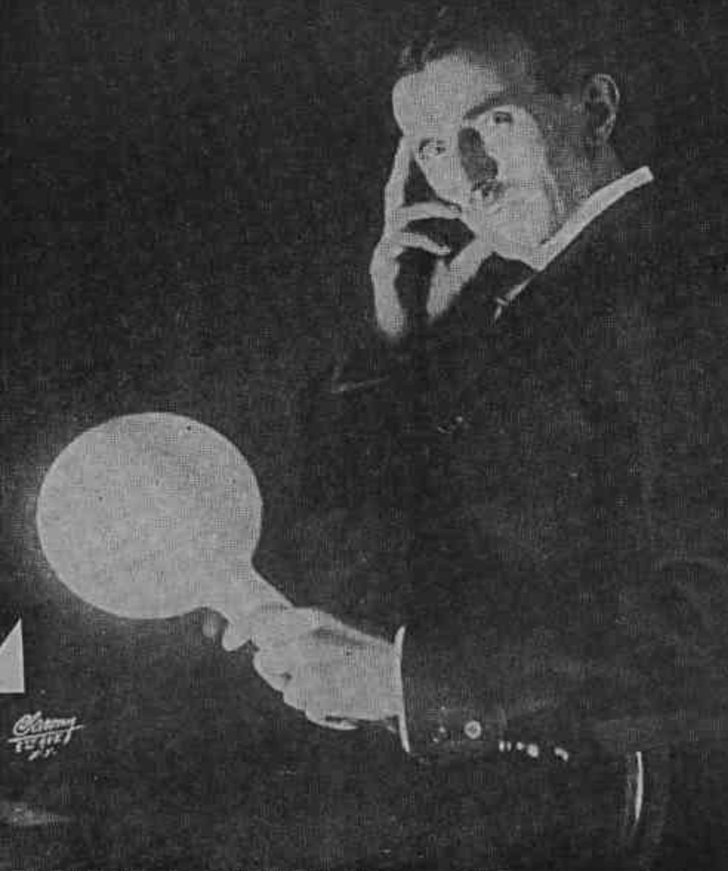
A estranha vida de Nikola Tesla